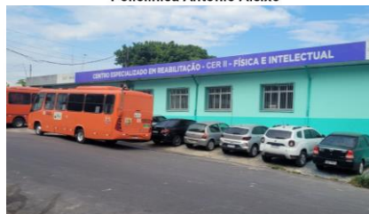
Centro de Reabilitação Colônia Antônio Aleixo