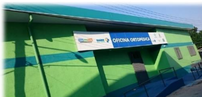
Oficina Ortopédica Fixa

www.amazonas.am.gov.br twitter.com/GovernodoAM youtube.com/governodoamazonas facebook.com/governodoamazonas