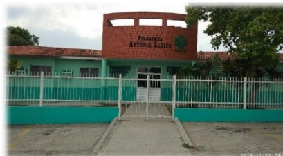
Policlínica Antônio Aleixo