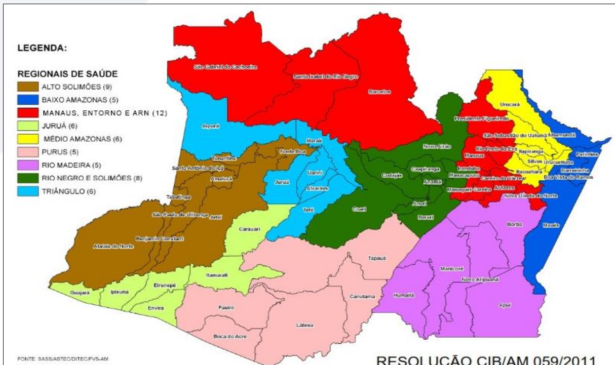
FIGURA 2: REGIÕES DE SAÚDE DO AMAZONAS